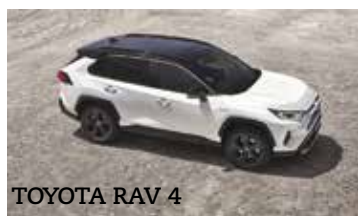
TOYOTA RAV 4